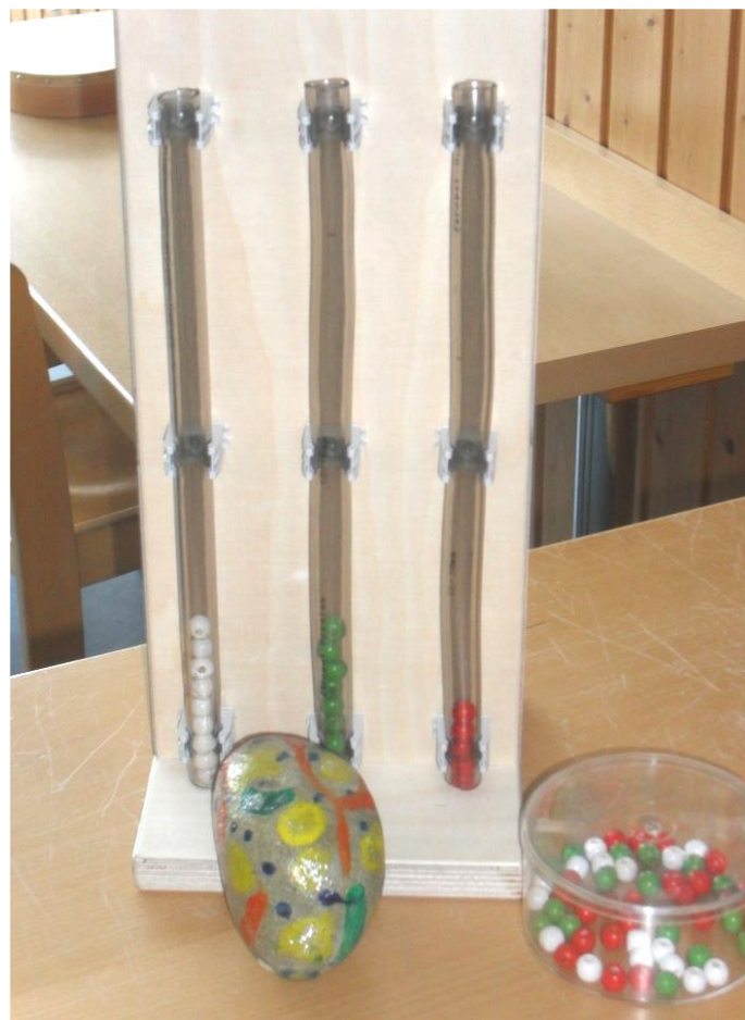
Abstimmgerät und Sprechstein

Es wird auch viel Wert daraufgelegt, den Kindern transparent zu machen, wie es zur jeweiligen Entscheidung gekommen ist. Hierfür werden in den Gruppen unterschiedliche Methoden zur Entscheidungsfindung angewandt.